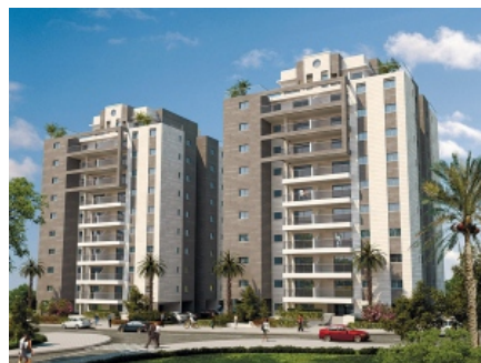
הדמיה של פרויקט מעלה אפגד באשקלון צילום: א.א. סטודיו

הדמיה של פרויקט מעלה אפגד באשקלון צילום: א.א. סטודיו. העסקה: שכונת ברנע באשקלון תמורת 1.57 מיליון שקל. הנכס ממוקם בקומה התשיעית, שבה שתי דירות, מתוך עשר. הדירה כוללת שתי חניות מקורות, ג'קוזי במרפסת, ואינה צופה לים כי אם לכיוון דרום-מזרח - לפארק. הדירה נרכשה על ידי משפחה למטרת מגורים והאכלוס הוא מייד. הבניין כולל מועדון דיירים ויגהל על ידי חברת ניהול. השכונה: שכונת ברנע מרכזת כיום את מרבית הבנייה החדשה באשקלון, ותחומה על ידי שכונת אפריר בדרום, הים ממערב ושטחים פתוחים מצפון וממזרח. העסקה בוצעה בבניין הנבנה בחלק הצפון-מזרחי של השכונה - שטח הנמצא בבנייה מסיבית של פרויקטים רבים, בבנייה של 9 עד 11 קומות. במתחם החדש יש גן ילדים אך עדיין אין בתי ספר, ועל התלמידים להרחיק לתחומה של ברנע הוותיקה יותר. ניתוח עסקה: בחינה של טווח המחירים עבור נכסים ייחודיים בשכונת ברנע באשקלון מעלה כי הוא רחב למדי, ונע בין 1.5 ל-2 מיליון שקל, בהתאם לכמה פרמטרים, שהעיקריים הם קרבה ונוף לים, גובה וכמובן שטח. כך, למשל, בפרויקט שבונה י.ח דמרי ברחוב דרך היין הסמוך, נמכר פנטהאוז גדול יותר, בן 6 חדרים, בשטח 180 מ"ר ו-170 מ"ר מרפסת בקומה 14 ועם נוף לים, ב-1.94 מיליון שקל. מעט דרומה משם, ברחוב בלפור, בטלה באחרונה עסקה שכבר נחתמה, לרכישת פנטהאוז בשטח דומה לנכס שבניתוח (150 מ"ר בניו-100 מ"ר מרפסת), בקומה שישית ועם נוף לים, שבה מחיר הסגירה היה 1.68 מיליון שקל. מאחר שדירת הפנטהאוז שבניתוח לא נהנית מאף יתרון יחסי למוצר מסוג זה - נוף, גובה או שטח יוצא דופן - הרי שמחירה נראה סביר.