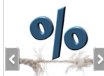
גם השנה צפוי משטר של ריבית ריאלית אפסית